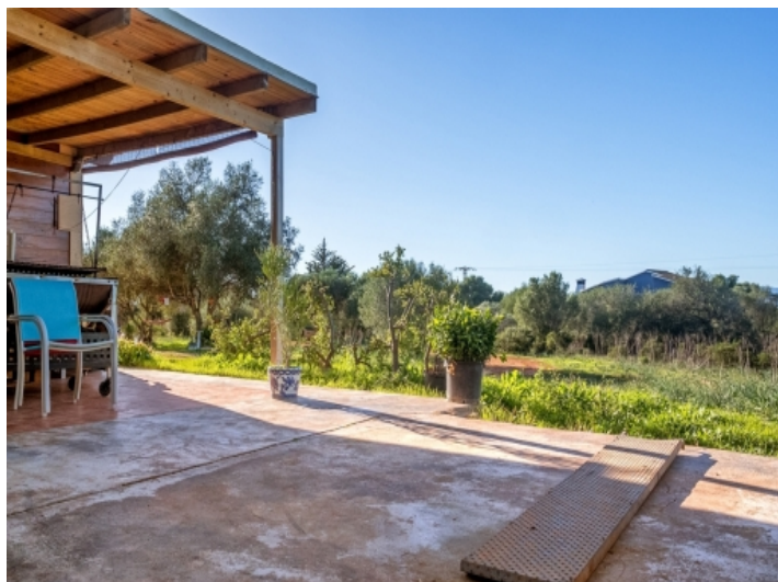
Die zukünftige Fina wird einen 60 qm großen Wohnbereich bieten