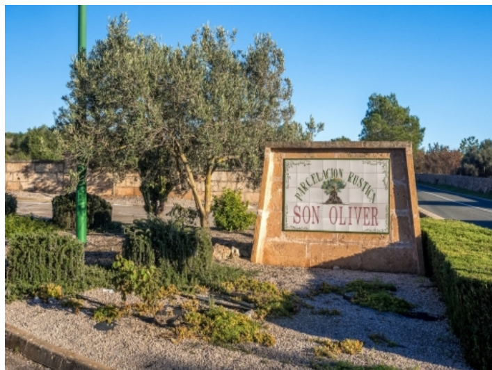
Das Grundstück befindet sich in einer ländlichen Umgebung