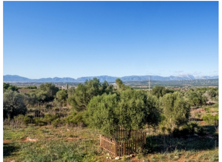
Idyllischer Ausblick auf das Tramuntanagebirge