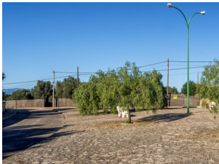
Die Urbanisation befindet sich in Flughafennähe