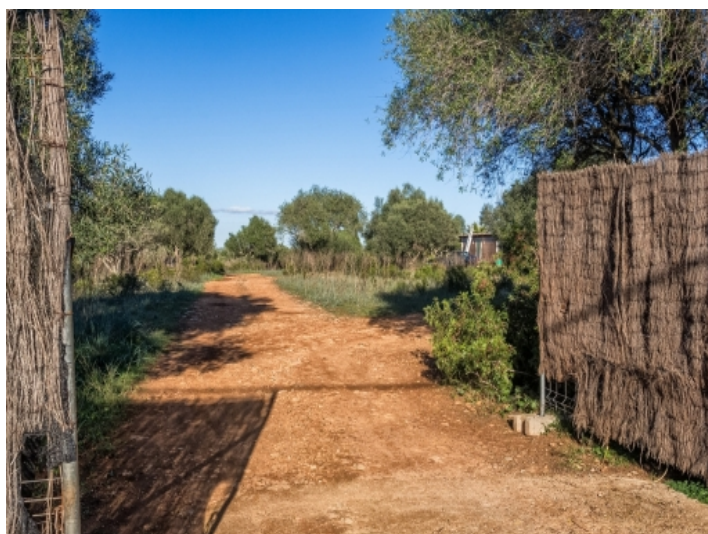
Eingang auf das Grundstück