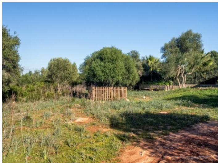
Ein hübscher Garten kann angepflanzt werden