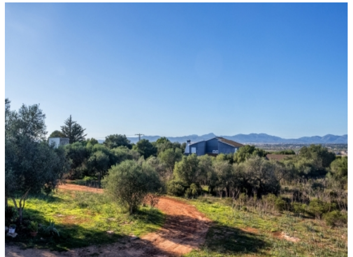
Das Grundstück ist leicht über eine asphaltierte Straße erreichbar