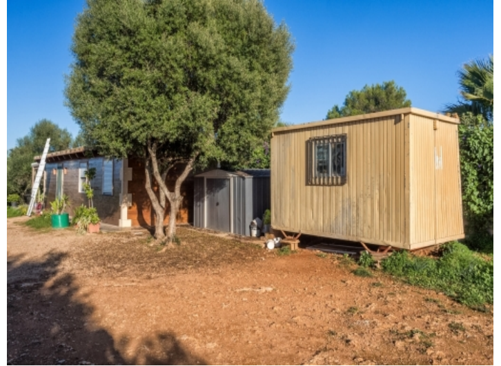
Eine 2-stöckige Steinfinca ist geplant