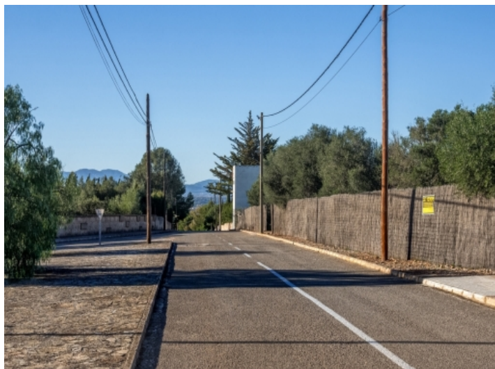
Man benötigt nur 15 Minuten nach Palma