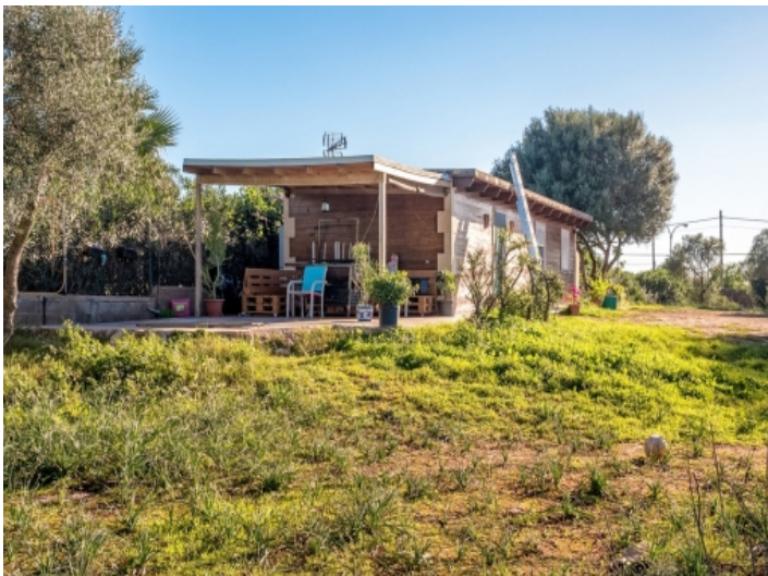
Die bebaute Fläche wird 407 qm betragen