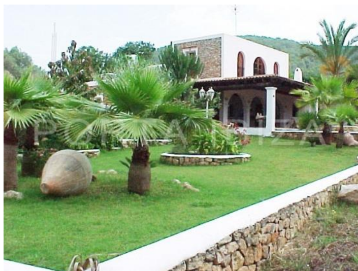
garden-fantastic finca-santa gertrudis-ibiza