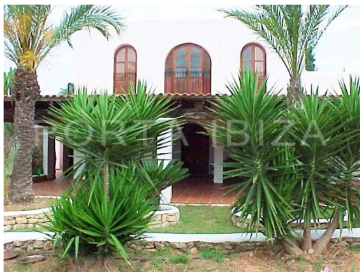
fantastic finca-santa gertrudis-ibiza