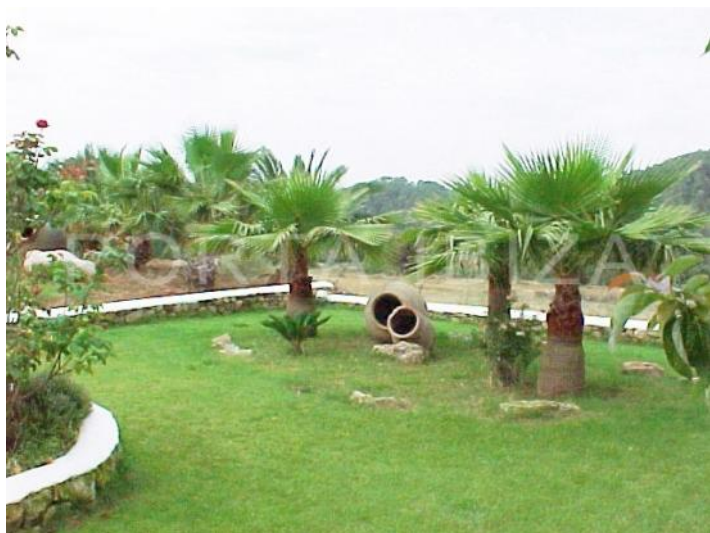
garden-fantastic finca-ibiza-santa gertrudis