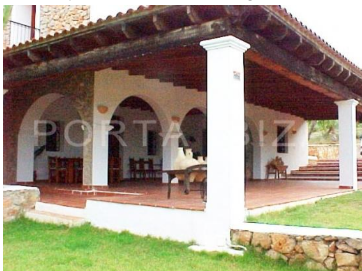
terraces-fantastic finca-ibiza-santa gertrudis