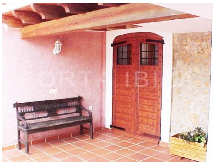
entrance-fantastic finca-santa gertrudis-ibiza