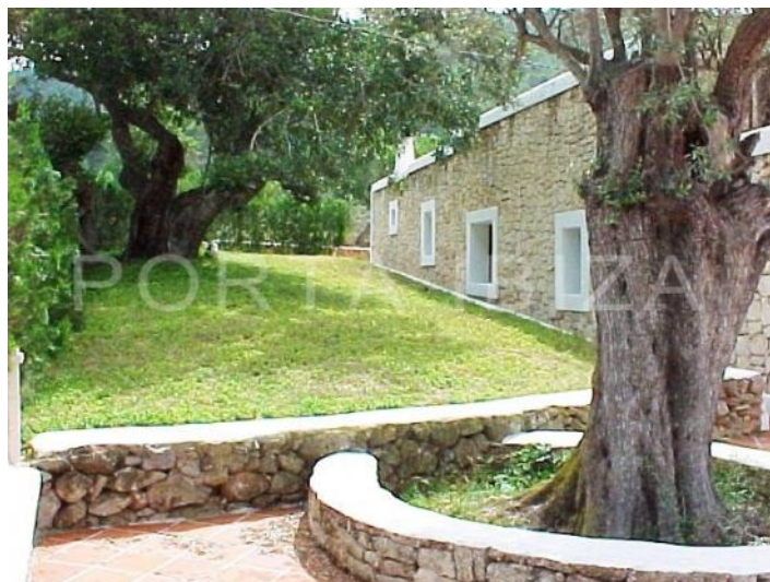
olive tree-fantastic finca-santa gertrudis-ibiza