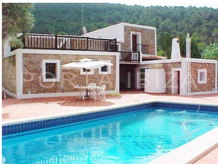
pool-fantastic finca-ibiza-santa gertrudis