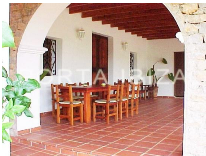
dinner terrace-fantastic finca-santa gertrudis-ibiza